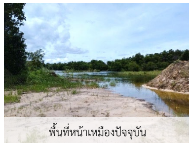
พื้นที่หน้าเหมืองปัจจุบัน