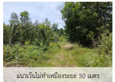
แนวเวนไม่ทำเหมืองระยะ 50 เมตร