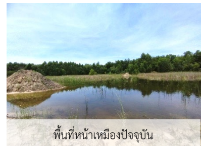
พื้นที่หน้าเหมืองปัจจุบัน