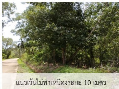
แนวเวนไม่ทำเหมืองระยะ 10 เมตร